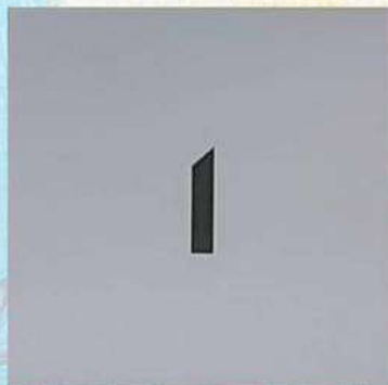
Franco Di Pede - FINESTRA acrilico su tela, 1980

"Ritmocromie" è un'opera di impianto optical basata su un minuzioso studio cromatico e percettivo. La ricerca gestaltica sulla percezione visiva e sull'integrazione fra il colore, il segno e la forma geometrica caratterizza i miei lavori fin dai primi anni Settanta. Giovanni Dell'Acqua