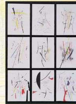
Nino Tricarico - L'EMOZIONE DEL TEMPO collage su carta, 2018

L'opera "La parabola del cerchio" ci introduce in ciò che i pitagorici non avrebbero mai voluto scoprire: il senso dell'infinito e dell'eterno ritorno. La "X" raffigurata nell'opera al centro del cerchio ci indica l'incommensurabilità del cosmo, quanto l'uomo stia ancora cercando consapevolezza del suo essere al mondo e il tentativo di decodificare razionalmente i codici dell'universo. Giulio Orioli